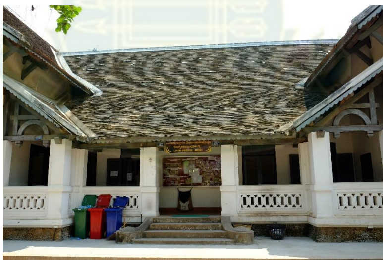
ภาพที่ 10 ห้องสมุดหลวงพระบาง สถาปัตยกรรมโคโลเนียล ศูนย์การเรียนรู้วัฒนธรรม

จากการวิจัยเชิงเอกสารและเชิงประจักษ์ที่หลวงพระบางพบว่า ประการแรกด้านภูมิทัศน์เชิงกายภาพ คณะผู้เชี่ยวชาญด้านวัฒนธรรมจากองค์การยูเนสโกแนะนำคณะกรรมการของสำนักงานมรดกหลวงพระบางด้านภูมิสถาปัตย์โดยให้นำสายไฟฟ้าลงใต้ดิน และห้ามป้ายไฟโฆษณาทุกชนิดในเขตอนุรักษ์มรดกโลก การบูรณะอาคารบ้านเรือนแบบสถาปัตยกรรมโคโลเนียล (colonial architecture) ซึ่งเป็นการผสมผสานระหว่างหน้าจั่วและหลังคาแบบตะวันออก กับตัวอาคารและเสาปูนแบบตะวันตก รวมถึงวัดวาอารามต่าง ๆ โดยใช้วัสดุอุปกรณ์ เช่น ปูนซีเมนต์ หลังคาอาคาร หรือ สีทาอาคารอะคริลิก (acrylic paint) ที่เหมือนหรือใกล้เคียงกับของเดิม และหลีกเลี่ยงวัสดุอุปกรณ์สังเคราะห์ที่ผลิตจากโรงงานอุตสาหกรรมทันสมัย เช่น พลาสติกหรือโพลีเมอร์ เพื่อคงสภาพดั้งเดิมไว้ให้ได้มากที่สุด และเป็นการเคารพสถานที่และไม่ให้กระทบต่อความรู้สึกของคนท้องถิ่น ซึ่งหากมีการเปลี่ยนแปลงทางกายภาพและสูญเสียภูมิสถาปัตยกรรมดั้งเดิมไป องค์การยูเนสโกอาจจะพิจารณาเพิกถอนทะเบียนมรดกโลกของหลวงพระบางได้ อย่างไรก็ตามอาคารหลายแห่งในหลวงพระบางได้กลายเป็นพิพิธภัณฑ์และศูนย์การเรียนรู้วัฒนธรรมดั้งเดิมของชุมชน