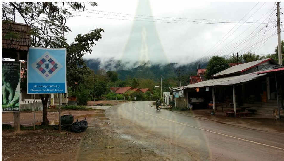
ภาพที่ 8 ชุมชนทอผ้าแพรลื้อ บ้านผานม หลวงพระบาง

การที่หลวงพระบางเป็นเมืองมรดกโลกด้านศิลปวัฒนธรรมทางพระพุทธศาสนา นำมาซึ่งอุตสาหกรรมการท่องเที่ยว และอุตสาหกรรมการท่องเที่ยวนี้เองกลายเป็นปัจจัยหลักของการเปลี่ยนแปลงทางสังคมวัฒนธรรมของเมืองและของชีวิตผู้คนในหลวงพระบาง เศรษฐกิจมีการขยายตัว อาชีพเก่า ๆ หลายอาชีพที่มีคุณค่าที่ถูกกลืนหายไป หรือที่กำลังจะเลือนหายไปจากสังคมกลับมาได้รับการรื้อฟื้นขึ้นมาใหม่ เช่น ช่างเงินช่างทองของบ้านธาตุน้อย การทอผ้าแพรลื้อของชาวลื้อบ้านผานม ซึ่งได้ถ่ายทอดมรดกทางวัฒนธรรมนี้ให้กับรุ่นลูกรุ่นหลาน สร้างอาชีพ สร้างรายได้ หรือแม้กระทั่งชนกลุ่มน้อยในพื้นที่สูงได้อพยพลงจากภูตอยมาขายสินค้าหัตถกรรมในพื้นที่เขตอนุรักษมรดกโลก กลายเป็นตลาดสินค้าท้องถิ่นที่ดึงดูดนักท่องเที่ยวและนักลงทุนอย่างมาก