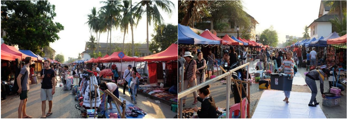
ภาพที่ 13 ตลาดกลางคืน หลวงพระบาง

เราสามารถพบเห็นได้ทั่วไปว่าปฏิสัมพันธ์ทางสังคมของคนลาวในหลวงพระบางเป็นแบบสมัยใหม่ผ่านเทคโนโลยีสารสนเทศ เครื่องมือสื่อสารที่ทันสมัย เชื่อมโยงกับโลกหรือสังคมที่อยู่ห่างไกล แต่ขณะเดียวกันคนลาวบางกลุ่มก็รู้สึกถึงความเจริญก้าวหน้าและการเปลี่ยนแปลงทางสังคมทำให้เกิดความรู้สึกกระทบต่อความรู้สึกผูกพันกับวิถีชีวิตดั้งเดิม และคุณค่าของวัฒนธรรมของบรรพบุรุษในอดีตที่กำลังอยู่ในภาวะเสี่ยง ทำให้เกิดภาวะการณ์ไม่ยอมรับกระแสโลกาภิวัตน์ขึ้นมา แต่ก็ไม่สามารถประท้วงเรียกร้องหรือแสดงออกได้อย่างชัดเจนมากนัก มีข้อเสนอผ่านกลุ่มอนุรักษ์สืบสานประเพณีวัฒนธรรมท้องถิ่นให้นำเอาวัฒนธรรมท้องถิ่นที่มีชีวิตชีวา (active) และหลากหลายอย่างเช่นวัฒนธรรมประเพณีทางพระพุทธศาสนา กลับเข้ามาในชุมชน ทำให้ชุมชนเห็นคุณค่าของวัฒนธรรมประเพณีนั้น ๆ และกลุ่มอนุรักษ์ปกป้องรักษาวัฒนธรรมประเพณีนี้เชื่อว่าจะเป็นพลังที่ยั่งยืนสามารถกำหนดวิถีการดำรงชีวิตและชะตากรรมของชุมชนท้องถิ่นได้เอง ซึ่งอาจจะไม่ต้องรอคอยการช่วยเหลือจากรัฐบาล และพึ่งพิงระบบเศรษฐกิจเสรีนิยมที่เน้นความเจริญด้านวัตถุแต่เพียงอย่างเดียว โดยอาศัยพื้นฐานความคิดว่าชุมชนเป็นรากฐานของชีวิต และชุมชนเป็นรากฐานของความคิดของการเป็นท้องถิ่นนิยม 68