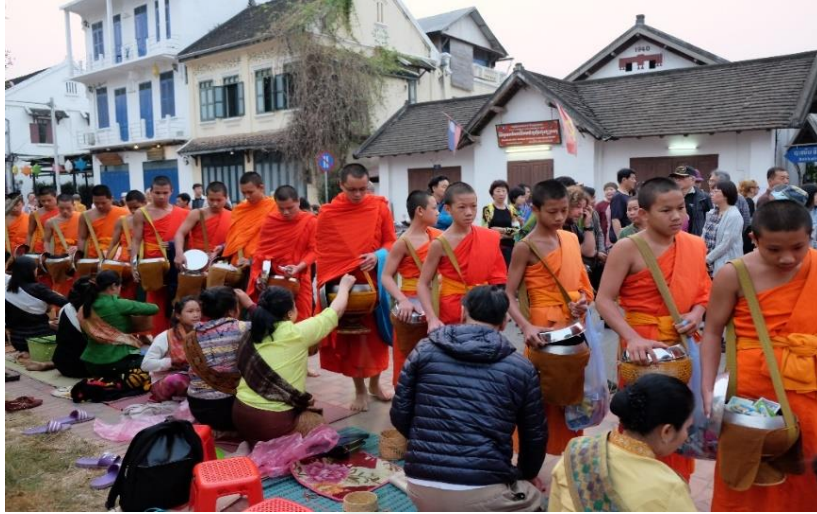
ภาพที่ 14 คนลารอดักบาตรข้าวเหนียว และนักท่องเที่ยว หลวงพระบาง

อย่างไรก็ตาม กลุ่มอนุรักษ์วัฒนธรรมประเพณียังคงไม่สามารถมีศักยภาพหรือแข่งขันพอเพียงพอที่จะต้านทานหรือต่อต้านพลังจักรวรรดินิยมสื่อและวัฒนธรรม (media and cultural imperialism) นี้ได้ อีกทั้งพลังอำนาจของมวลชนของสปป.ลาวไม่ได้เป็นผู้รับสารที่ถูกกระทำ (passive audience) แต่กลุ่มอนุรักษ์วัฒนธรรมประเพณีเชื่อมโยง (articulation) วัฒนธรรมตะวันตกกับวัฒนธรรมท้องถิ่นโดยไม่ได้ปิดกั้นวัฒนธรรมอื่นในขณะเดียวกันก็พยายามอนุรักษ์วัฒนธรรมท้องถิ่นของตนไม่ให้ถูกกลืนไปกับวัฒนธรรมต่างชาติอื่น ซึ่งต้องอาศัยนโยบายระดับประเทศของสปป.ลาวคอยกำกับและสอดส่องดูแลไม่ให้วัฒนธรรมของลาวกระทบกระเทือนไป