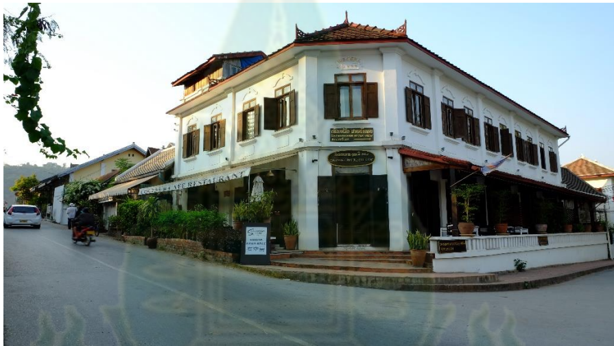
ภาพที่ 11 อาคารเก่าแบบโคโลเนียลถูกดัดแปลงเป็นโรงแรมให้กับนักท่องเที่ยว ริมน้ำคาน หลวงพระบาง

องค์การยูเนสโกกังวลการบริหารจัดการเมืองมรดกโลกทางวัฒนธรรมและสถาปัตยกรรมที่สภาพแวดล้อมกำลังค่อย ๆ เปลี่ยนแปลงไปจากเดิมซึ่งเป็นการทำลายสภาพดั้งเดิมของเมืองแห่งนี้ อีกทั้งกระบวนการไหลบ่าของอารยธรรมและวัฒนธรรมตะวันตกข้ามพรมแดนนำไปสู่ผลกระทบและการเข้ามาครอบงำวัฒนธรรมท้องถิ่น ดังเห็นได้จากการสูญเสียสภาพสิ่งแวดล้อมดั้งเดิมทางกายภาพจากการกระบวนการทำให้ทันสมัย (modernisation) พร้อมสิ่งอำนวยความสะดวกของเมืองในด้านต่าง ๆ ดังที่กล่าวมาแล้วในตอนต้น เช่น โรงแรม ร้านอาหาร และสถานบริการ เป็นต้น วัฒนธรรมกระแสการบริโภคนิยมกำลังคุกคามจิตวิญญาณความเป็นชุมชนเดิมหลวงพระบางดั้งเดิมเพื่อตอบสนองความต้องการของตลาดเสรีนิยม ซึ่งทำให้สภาพสังคมและวัฒนธรรมรวมถึงวิถีชีวิตของประชาชนในเมืองหลวงพระบางกำลังถูกขัดและถูกคุกคามกลายเป็นวัฒนธรรมเดียวกันทั่วโลก แต่ก็มีแรงต้านทานกระแสโลกาภิวัตน์จากกลุ่มอนุรักษ์วัฒนธรรมท้องถิ่นอยู่บางส่วนที่รณรงค์ให้ประชาชนลาวและนักท่องเที่ยวตระหนักถึงคุณค่า เคารพ และอนุรักษ์วัฒนธรรม จารีตประเพณีดั้งเดิมของคนลาวหลวงพระบางที่ปฏิบัติสืบต่อกันมา