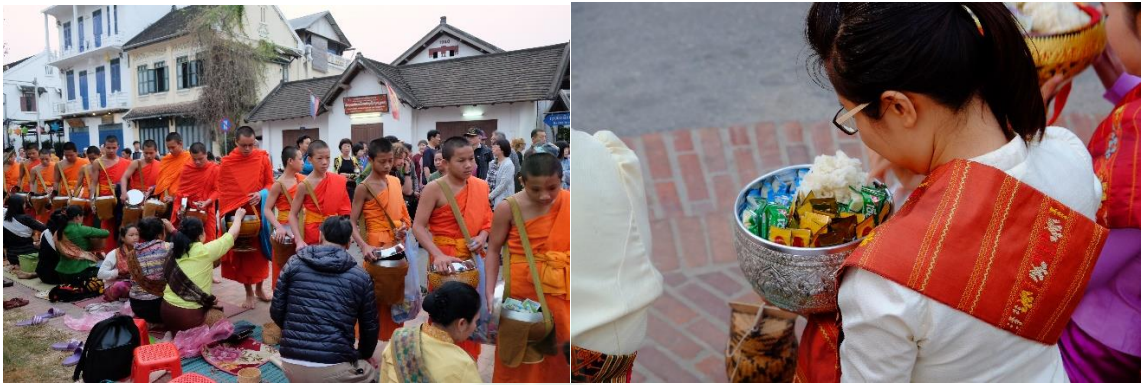
ภาพที่ 12 การตักบาตรข้าวเหนียวของคนลาว หลวงพระบาง

ได้เข้าใจคุณค่าของประเพณีการตักบาตรนี้อย่างแท้จริงไม่ อีกทั้งคนลาวท้องถิ่นเองที่เข้ามาตักบาตรส่วนใหญ่เป็นคนที่มียาอยู่ในช่วงวัยกลางคน ไม่ค่อยได้เห็นเด็กวัยรุ่นมากนัก ซึ่งผู้เชี่ยวชาญและนักอนุรักษ์ด้านวัฒนธรรมกำลังเป็นห่วงถึงการสูญเสียคุณค่าทางวัฒนธรรม ความสัมพันธ์ระหว่างวัดกับชุมชน การถ่ายทอดและความสืบเนื่องของวัฒนธรรมจากรุ่นสู่รุ่น